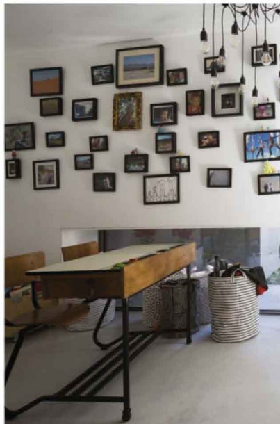
De eigenares plukt ideeën van Pinterest.

Bouwjaar: 2015 - 2016 Oppervlakte perceel: 10 are Bewoonbare oppervlakte: gelijkvloers 171 m 2 , bovenverdieping 112 m 2 Ruwbouw: beton, snelbouw-baksteen (gepleisterd) en hout Vloer: gepolierd beton (gelijkvloers), hout (boven), granitotegels (badkamer) Ramen: geanodiseerd aluminium BEN-woning: geothermische warmtepomp, zonneboiler, thermische zonnepanelen Kostprijs: ruwbouw en winddicht (zonder kelder): 1.200 euro/m 2 (excl. ereloon architect en btw) Architect: Clauwers & Simon Architectes, met medewerking van Harm Saanen www.clauwerssimon.com http://infobeton.be