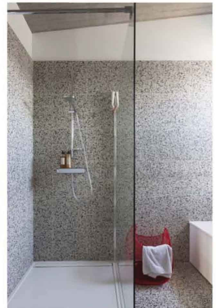
De badkamer in granito-tegels.