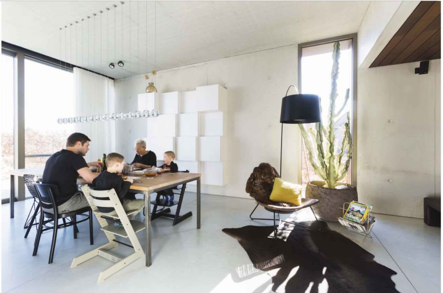
Zwart en goud komen in het hele huis terug.

kwam het goed uit dat bepaalde wanden niet in beton zijn maar in gyproc.